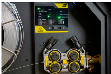
Le meilleur système de dévidage de sa catégorie

Consultez le site esab.com pour plus d'informations.