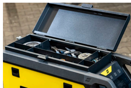
Boîte à outils optionnelle pour les accessoires